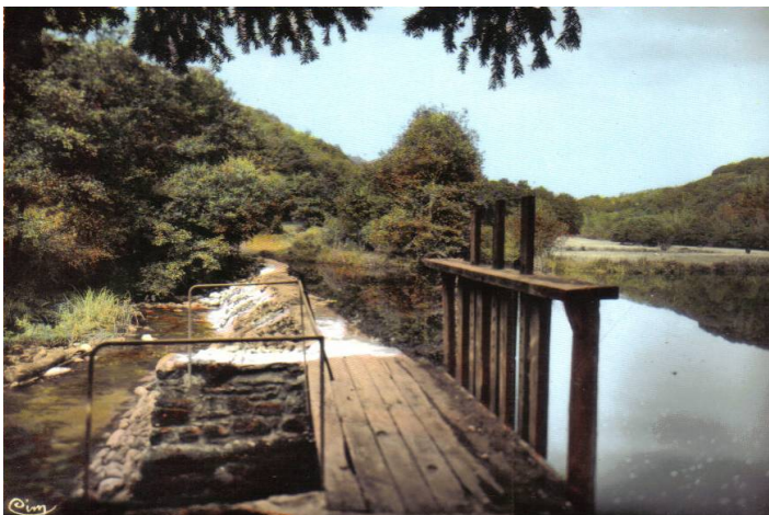
La retenue du Moulin Neuf de Saint Thurien sur l'Isole.

Son territoire est bordé à l'ouest et au sud par l' Isole , une rivière au cours sinueux qui coule dans une vallée boisée et profondément encaissée. Au nord coule le ruisseau de Saint-Eloi.